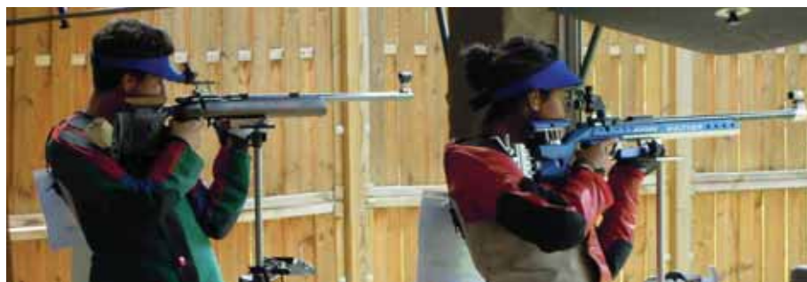
ZHSV 3-Stellungsmatch: Mit Doppelführung ins Final