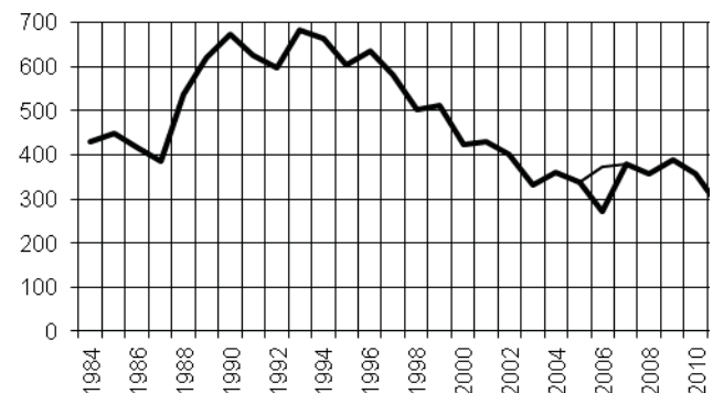
Total 10er- und 5er-Siche