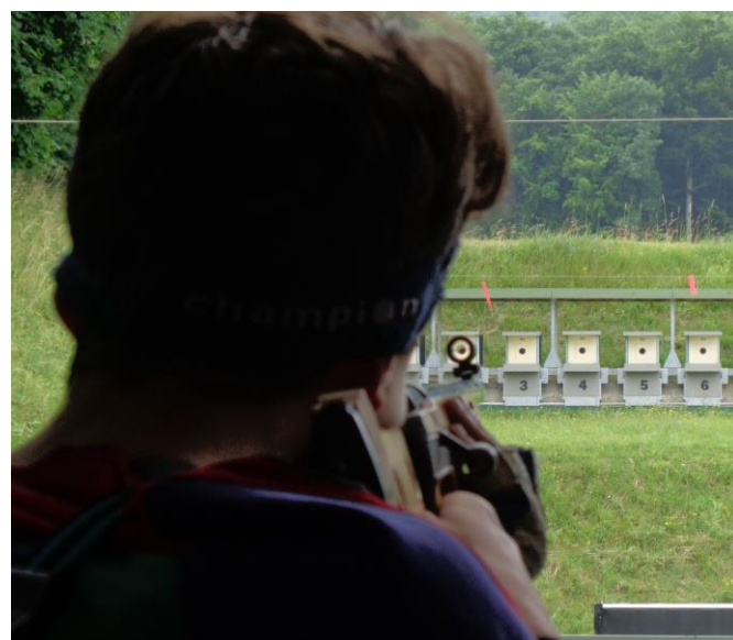
Oben: Kleinkaliberscheibe mit zugehöriger Munition Unten: Perspektive des Schützen